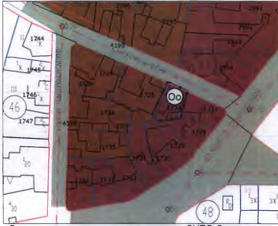
Скица с предложение за изменение на ОУПО Севлиево, за ПИ 65927.501.1726, по КККР на гр. Севлиево, общ. Севлиево М 1:1000