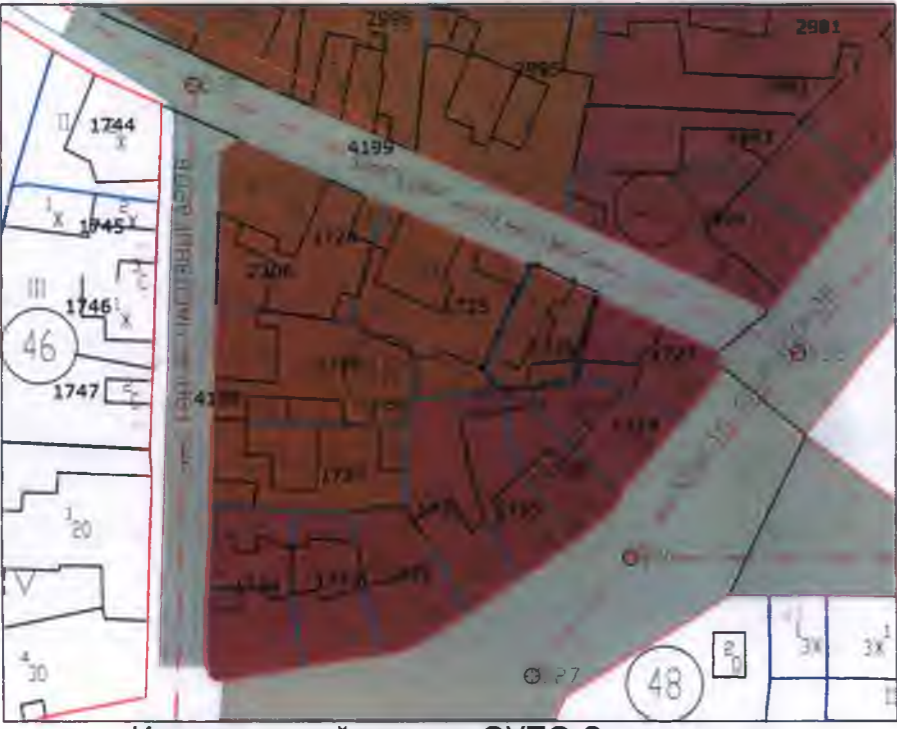
Извадка от действащия ОУПО Севлиево, за ПИ 65927.501.1726, по КККР на гр. Севлиево, общ. Севлиево М 1:1000